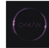
logo: Martin Poláček