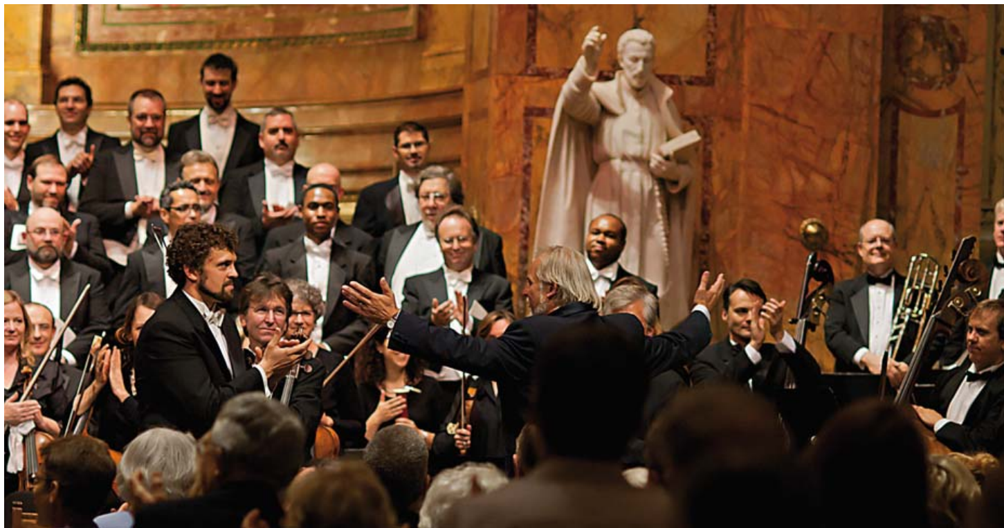
kostel Sv. Ignáce z Loyoly v New York, uvedení rekvie Oratio Spei

// Mimo jiné jste tak otevřel 23. sezónu Sacred Music in a Sacred Space. Představte prosím tento projekt trochu blíže.