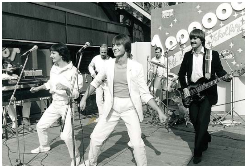
koncert ke zlaté desce za milion prodaných nosičů na střeše obchodního domu Kotva, rok 1983

Hudební skladatel , producent, nakladatel, vydavatel, vášnivý tenista a fotbalista. Vyučil se nástrojařem, absolvoval vojenskou službu v Plzni, kde poté začal studovat na státní konzervatoři. Studia dokončil v Praze. S Janem Vyčítalem založil v polovině 60. let skupinu Greenhorn. Od roku 1968 byl členem divadla Semafor Jiřího Suchého a Jiřího Šlitra. Jeho další kroky mířily do západního Berlína do doprovodného orchestru muzikálu Hair. Po návratu z Berlína nastoupil do orchestru Josefa Vobruby. Roku 1971 se stal kapelníkem Evy Pilarové a dva roky nato sestavil kapelu a započala spolupráce s Hanou Zagorovou. V roce 1990 založil Multisonic. Mezi jeho nejznámější hity patří Holky z naší školky, Hej, mistře basů, Ahoj, léto a další. Zastupován OSA od roku 1979, členem se stal roku 1992.