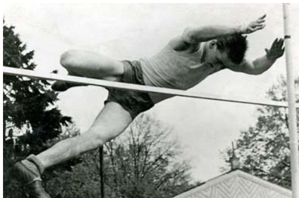
skok o tyči závody v Mladé Boleslavi, rok 1956