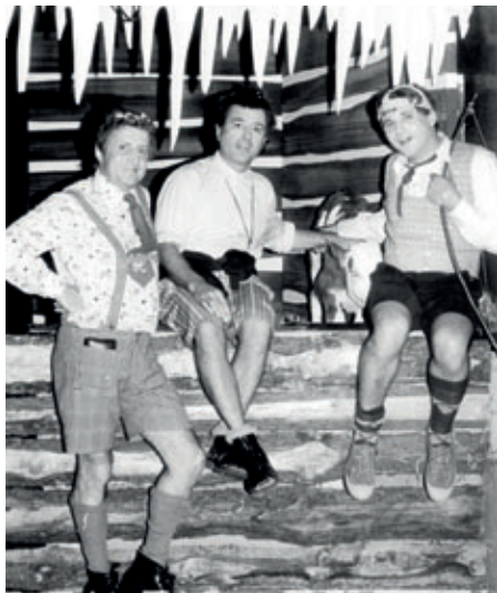
Pavel Bobek, Petr Janda, Karel Zich