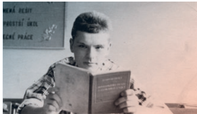
Budoucí textař na střední předstírá, že se učí. Foto z roku 1958 až 1959.

Šedesátá léta jako každá jednou skončila. A blbě. Přijely tanky, nastoupil Husák a normalizace, které jsme říkali nenormalizace.