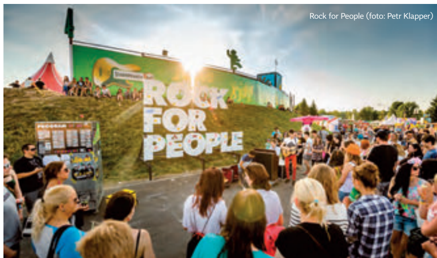
Rock for People

Čech po návštěvě Szigetu zůstane každopádně ohromený velikostí produkce a fungováním věcí, na které není z domova zvyklý. Jako příklad mohou posloužit i takové detaily, jako jsou toaletní papíry na toaletách po