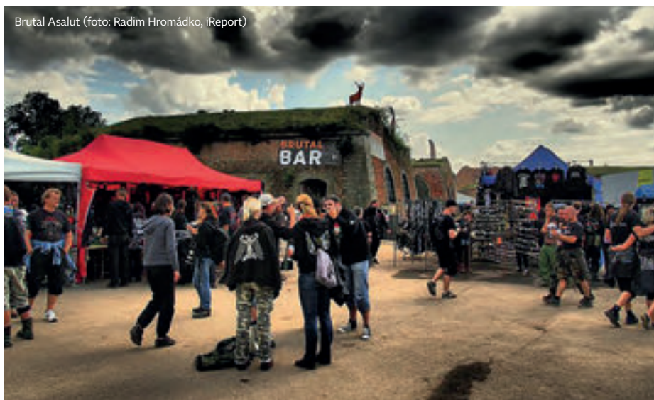
Brutal Assault

nudnou dramaturgii mají i Majáles nebo Votvírák, který se koná zhruba v polovině června. I ty dokážou nalákat na česko-slovenské menu desetitisíce návštěvníků. V souvislosti s hudební dramaturgií Votvíráku, Hradů CZ nebo Majálesu se nejednomu musí vybavít věčné a relevantní nadávání na dramaturgii většiny českých rádií. Je smutné, že je konzervativní vkus v Češích podporován z tolika stran.