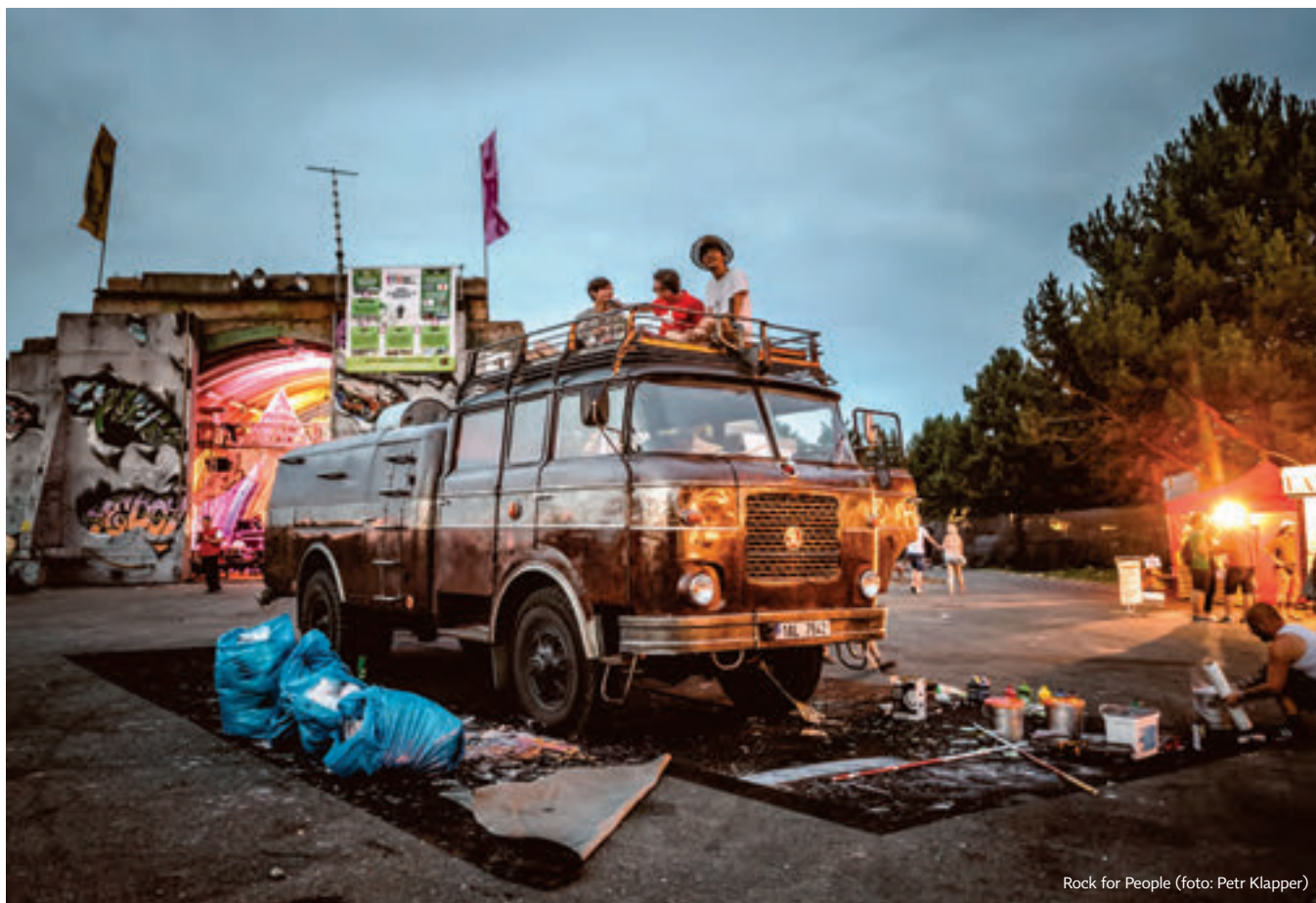
Rock for People

Sziget v posledních ročnících navštívilo vždy přes čtyři sta tisíc lidí a pro mnohé to je nejlepší festival v Evropě. Pořadatelům je jasné, že ještě dlouho nebudou moci soupeřit s věhlasným line-upem Glastonbury a podobně slavnými hudebními svátky, a proto se snaží příchozí zabavit jinak. Svým návštěvníkům nabízejí bohatý doprovodný program, kde si každý může najít své. V nabídce jsou taneční workshopy, cirkusová vystoupení, prohlídka luminária, bungee jumping a mnoho dalších atrakcí. Je to takové město ve městě. Každý návštěvník dostane provizorní bezkontaktní platební kartu, kterou si nabije, a jen pomocí ní lze platit. Nikdo tak v ruce nezkontroluje hodnotu forintů, které jsou pro velkou část cizinců příliš exotické, a nepřepočítává, zda mu obsluha vrátila správně.