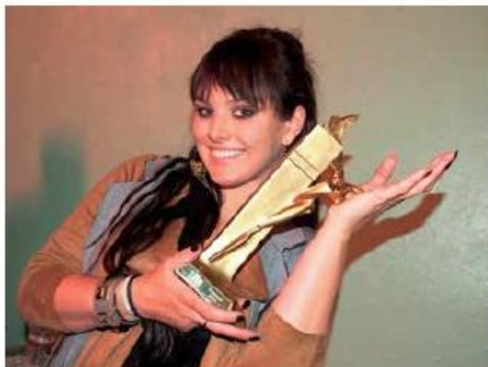
Ewa Farna