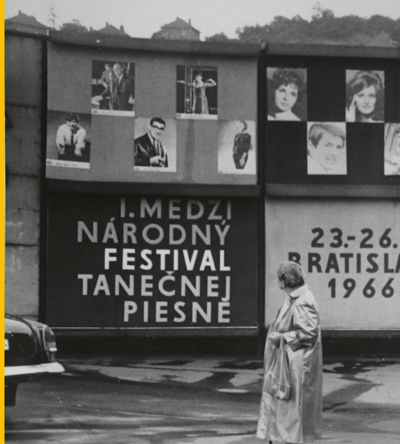
Bratislavská lyra, 1966