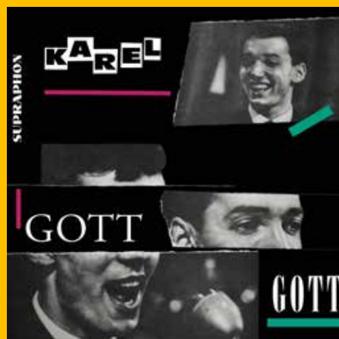
LP Zpívá Karel Gott

Bujný rozvoj mladé československé popkultury, vystrkující růžky i za hranice republiky, zarazily tanky armád varšavského paktu v čele se Sovětským svazem. O tom ale až příště. ☒