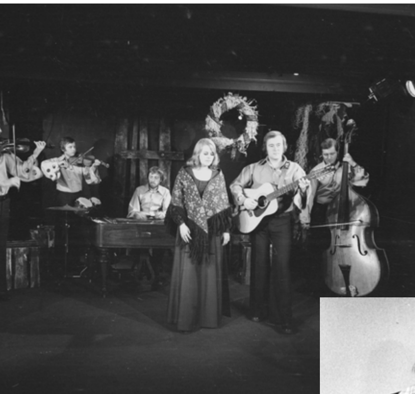
1975, foto: Jef Kratochvil