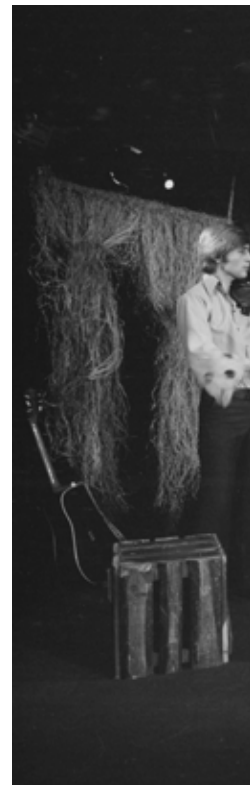
1975, foto: Jef Kratochvíl

připadala niterná a přímočará. Rytmiku a drive téhle muziky lze lehce vystopovat u tehdejších Atlantis a pak i na zmíněném prvním monotematickém albu Ulrychovců a kapely Atlantis.