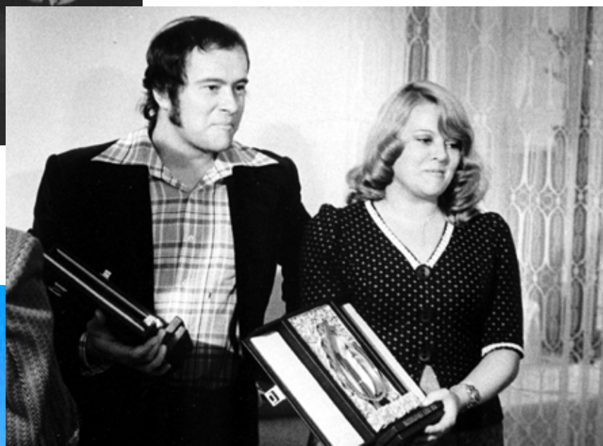
Bratislavská lyra, 1976