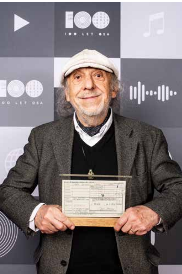
Jeden z dílů seriálu je věnován Jiřímu Stivínovi