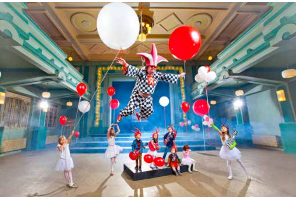
Kašpárek v rohlíku