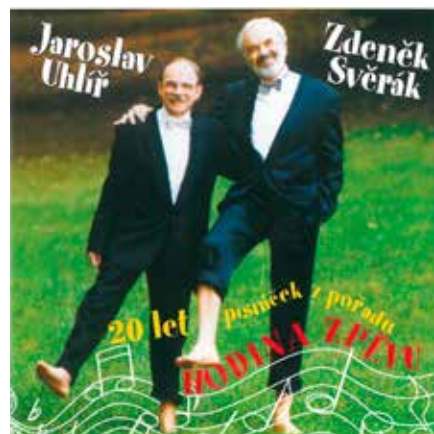
Obal CD Hodina Zpěvu

Druhý titul bude možná překvapením. Ruské zfilmování románu Julese Verna