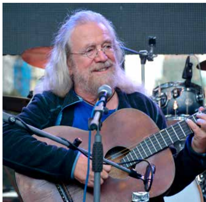
Jaroslav Hutka (2016)

rince a Ložíkovi (2008), v němž – především v instrumentaci – sáhla k inspiraci lidovou písní. Ve své kategorii je to však deska, která zapadla, protože se přes svůj potenciál nedokázala mediálně uchytil.