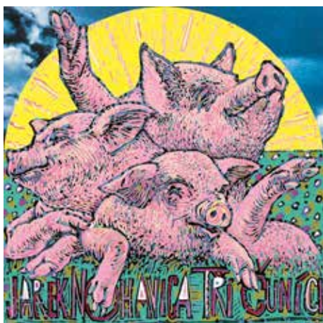
Tři čuníci

V domě v jedné z vedlejších ulic Prahy 3 se každý týden schází malý oddíl Vlčata. Není na něm nic výjimečného, snad jen to, že jejich vedoucí ráda zpívá a svou lásku ke zpěvu přenesla na partu devíti až desetiletých dětí. A ty zpívají s takovým gustem, že je to slyšet až na ulici. Cože to zpívaly minulý týden? Svěrákovy a Uhlířovy písně Dělání a Když se zamiluje kůň, Redlovu Sbohem, galánečko, Nohavicův evergreen Tři čuníci a další zvířecí hit – Máme rádi zvířata. Dojímaně vyzněla z Anděla Páně II známá Modlitba. Jožin z bažin se moc nepovedl, zato závěrečnou Mašinku s nadšeně zazpívaným veršem „veze samý vožralý“ zvládla děcka na jedničku. Mezitím jim sama vedoucí zazpívala Pokáčovu Kočku. Tak tohle jsou písničky pro děti? A existují vůbec písničky pro děti?