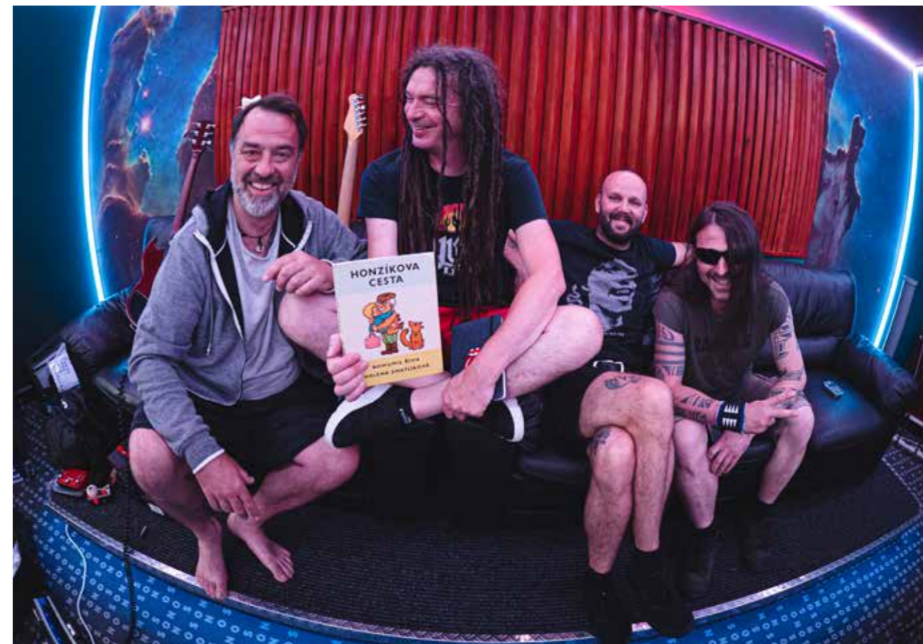
Ve studiu s s Kurtizánami z 25. Avenue, foto: Jan Nožička

Koncertovali jsme s Teorií morfické rezonance a nějak jsem to dával, i když to pro mě občas bylo něco strašlivého. Jeden rok třeba šedesát koncertů, někdy