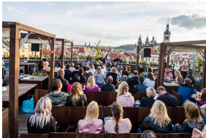
Turné na střechách, foto: archiv kapely / BrainZone

My si hodně vážíme toho, že jsme vydrželi 30 let ve stejné sestavě. Navíc u nás umí každý ještě nějaké další věci, což je důležité, protože kapela nemůže spoléhat jen na vydavatelství, musíš se hodně snažit i sám.