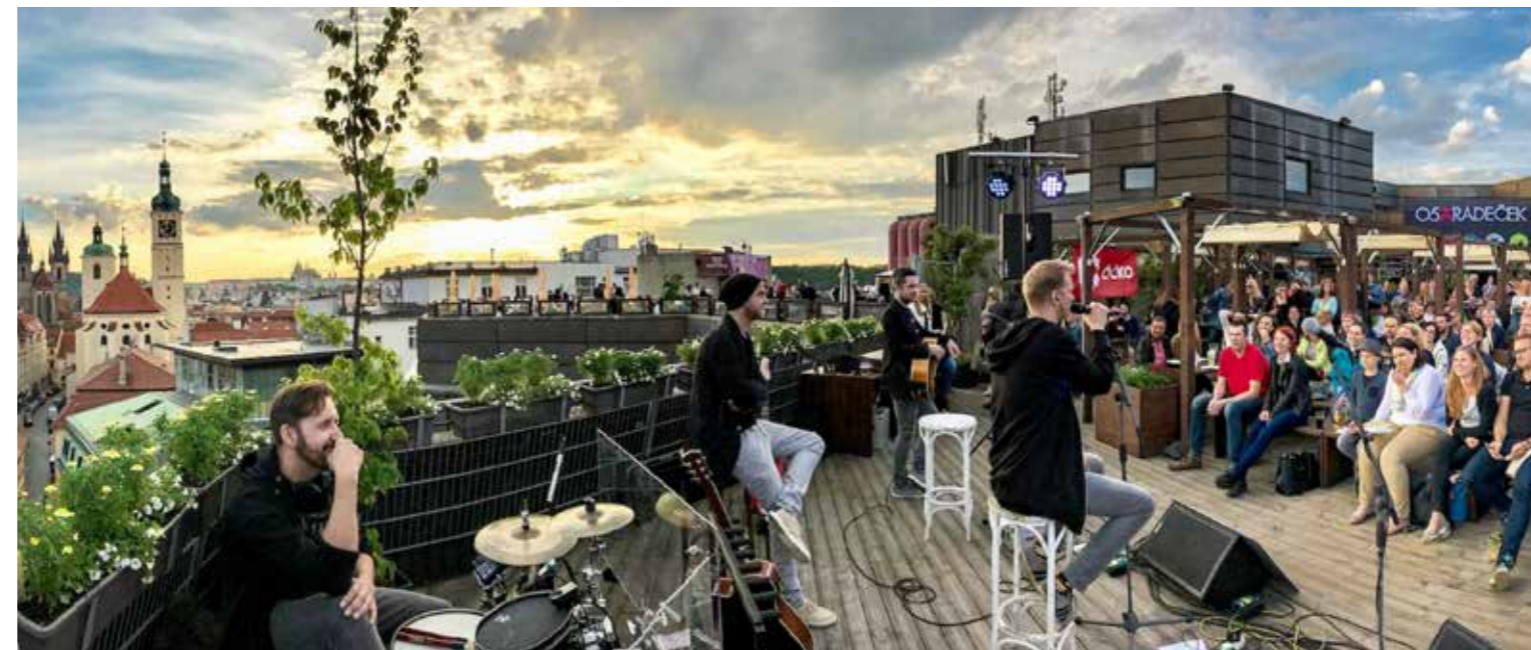
Turné na střechách, foto: archiv kapely / BrainZone

Tomino: Řečeno slovy klasika – jsme zkrátka ti, co k sobě patří. ☒