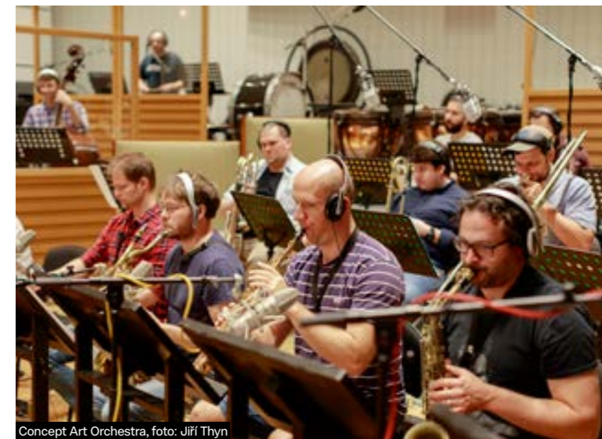
Concept Art Orchestra, foto: Jiří Thyn

Hlavním momentem vývoje scény se stala institucionalizace jazzového vzdělávání. Jeho efekt se projevil až se zpožděním a ještě kolem roku 2015 se mluvilo spíše o pozitivním vlivu zahraničních škol na nové jazzové skladatele, protože zprvu studovali hlavně v Polsku, Norsku nebo ve Francii. Ale s odstupem času