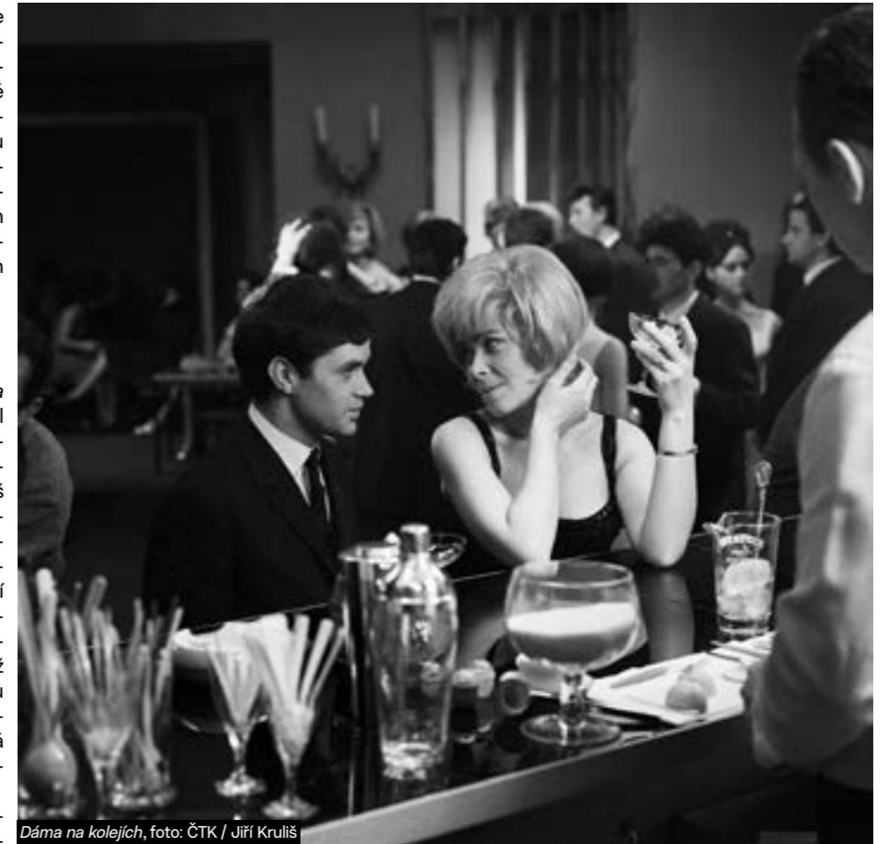
Dáma na kolejích, foto: ČTK / Jiří Kruliš

Se srpnem 1968 a následnou normalizací skončila i slavná éra českého hudebního filmu. To neznamená, že by